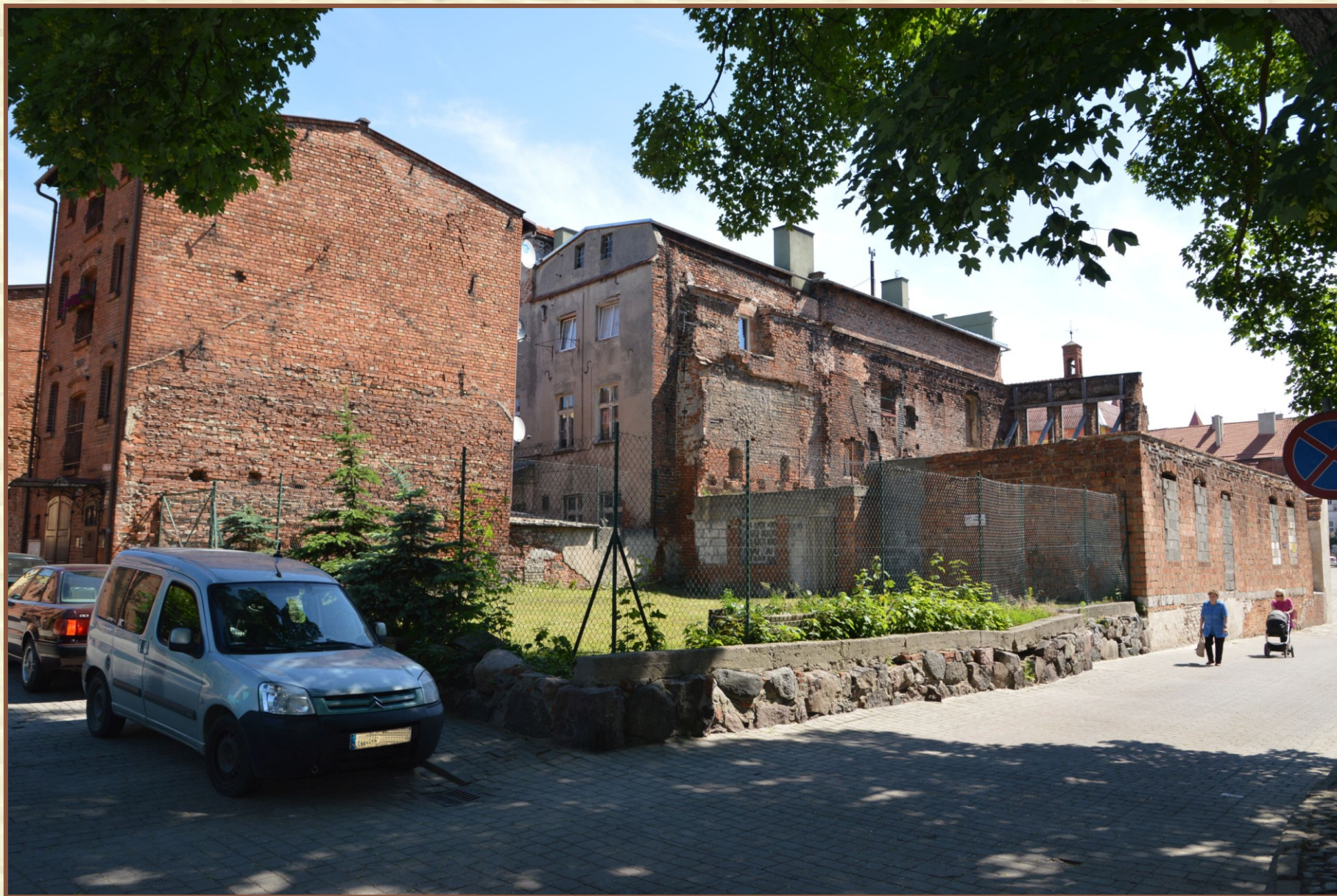
Widok na nieruchomość od ulicy Gostomskiego – zaplecze kamienic.