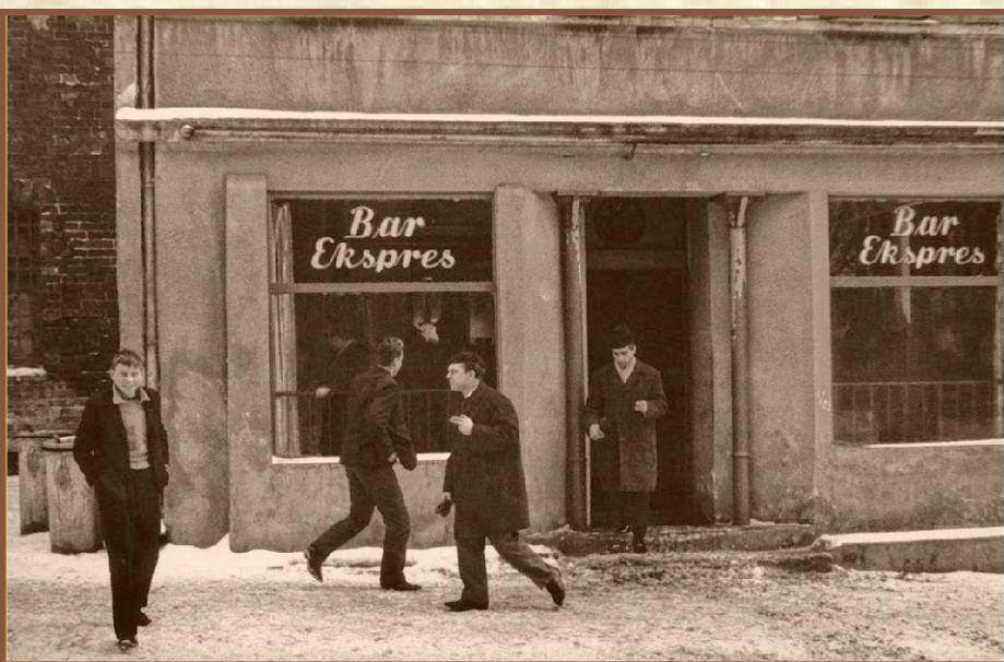
Gniezno, pl. Grunwaldzki od strony zachodniej, kamienice przy ratuszu – lata sześćdziesiąte XX w. (zawsze pełny Bar Ekspres)