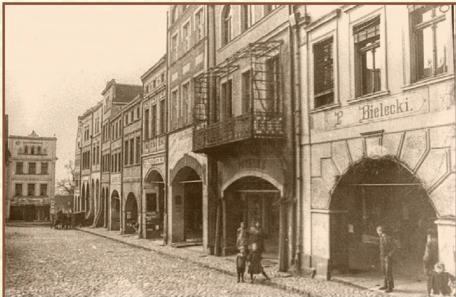
Gniezno, plac Grunwaldzki, pierzeja zachodnia - ok. 1919 r. (W kamienicy z balkonem w roku 1928 gościł malarz Leon Wyczółkowski)