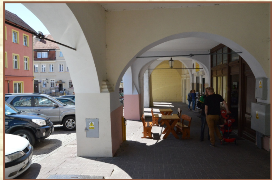
Widok na front kamienic 6 i 7 od „rynku” - Plac Grunwaldzki.