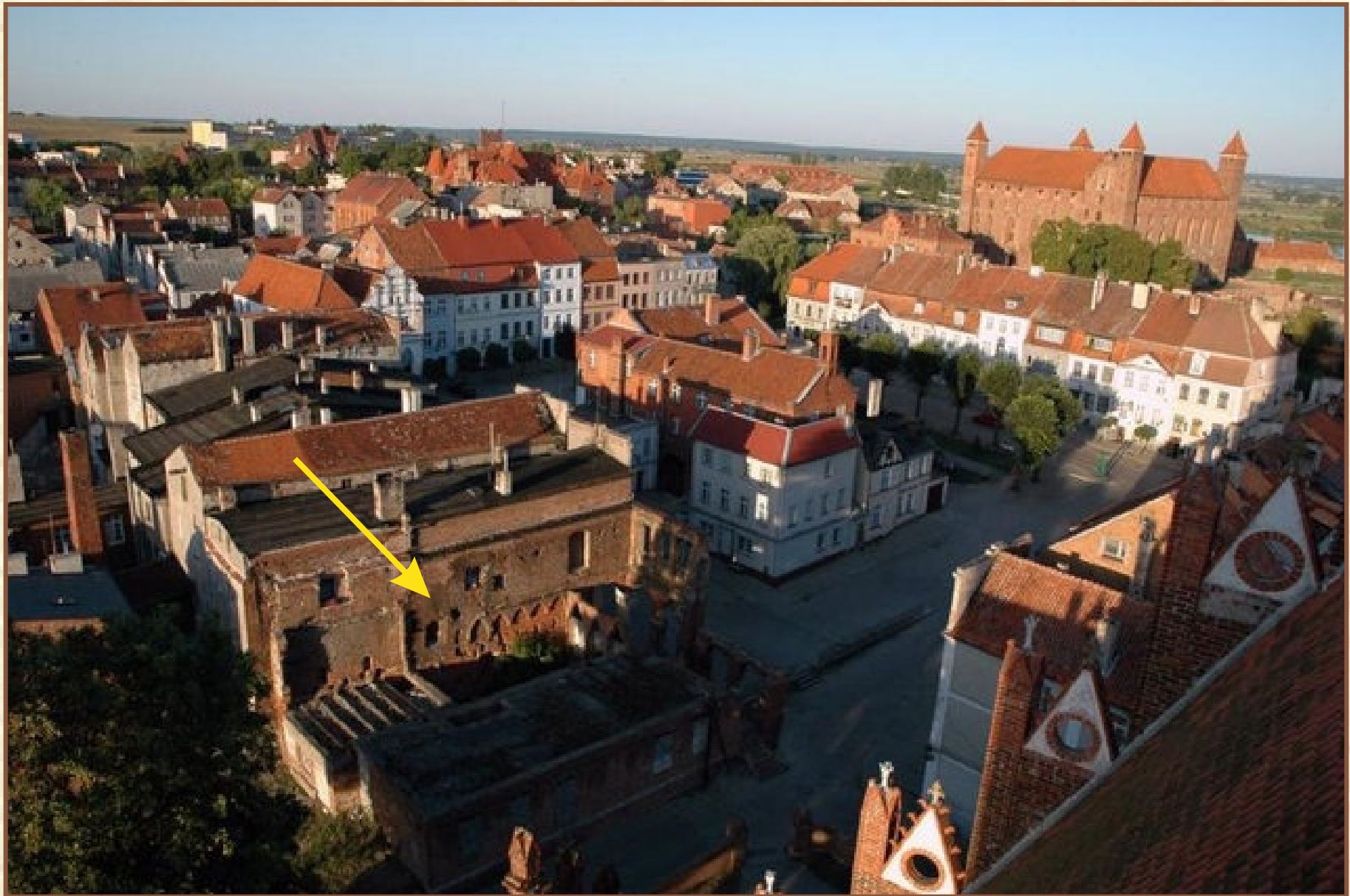
Widok na nieruchomość z lotu ptaka. Położenie w centrum Starego Miasta.