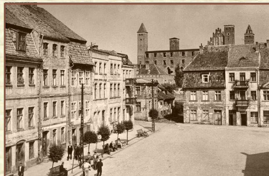
Gniezno, plac Grunwaldzki od strony północnej – lata sześćdziesiąte XX w. (przystanek PKS na rynku, w narożniku północno-wschodnim nieistniejąca dziś kamienica)