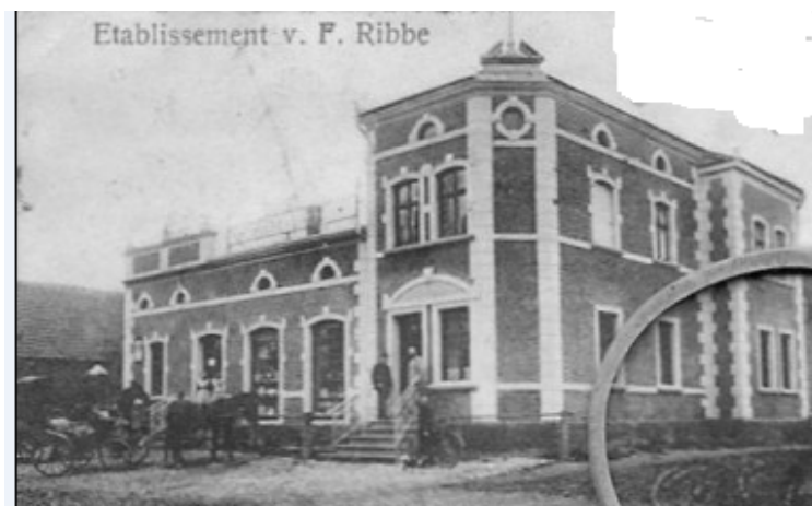
FRAGMENT KARTKI POCZTOWEJ Z 1909 R.

Sklep i bar właśnie wystawiono na sprzedaż. Wszystko się zmienia i kiedyś kończy, czy po ponad 110 latach budynek zachowa choć w części swą pierwotną funkcję?