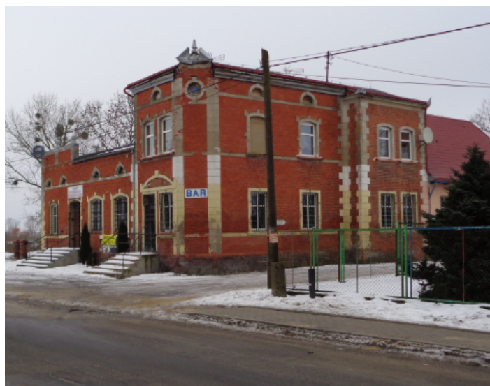
DAWNY „ETABLISSEMENT” W WIELKICH WALICHNOWACH. WIDOK OBECNY