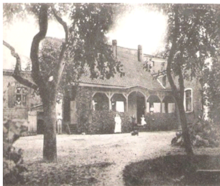
POCZTÓWKA Z 1919 R. WIDOK OD STRONY OGRODU