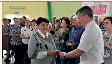
INAUGURACJA W CEKCYNIE

Patroni Honorowi naszych pro-seniorskich projektów: