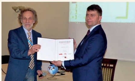
INAUGURACJA W BOLESŁAWIU

Nasze Stowarzyszenie wspiera i daje narzędzia niezbędne do współtworzenia Programu Gmina Przyjazna Seniorom. Pomożemy wprowadzić wszystkie elementy Programu w Państwa samorządzie.