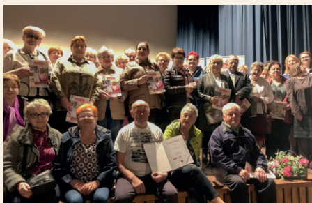
INAUGURACJA W GRYBOWIE