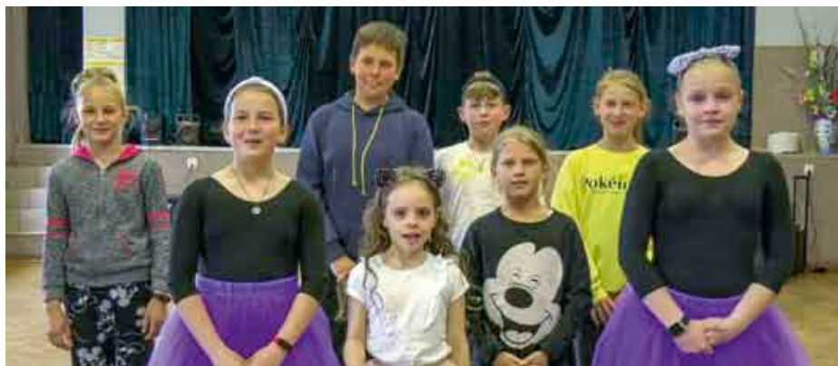
Gniewski Inkubator Kultury zrzesza środowiska zainteresowane rozwojem kultury w Gminie Gniew

– To dla nas niezwykle cenny dokument, swoisty drogowskaz dla naszej instytucji, wskazujący nam kierunek rozwoju zgodny z oczekiwaniami