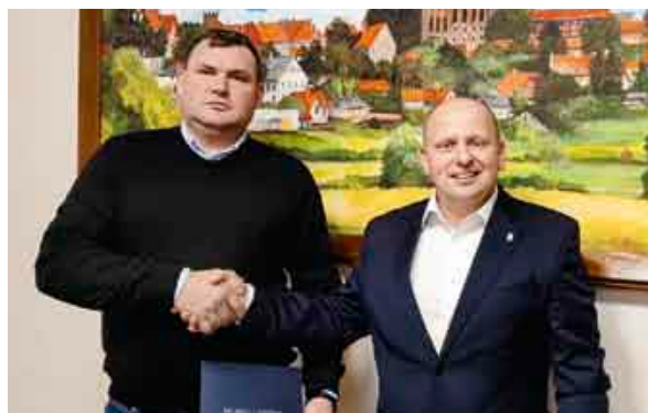
zadania. Remont wykona opaleńska firma Sowa Trans. Zadanie wykonanie ma zostać w listopadzie tego roku. ■